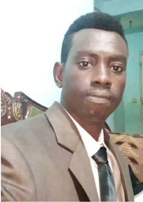
RD: Órré'ñ kilmá