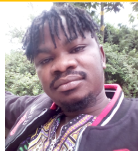
RD: Nyantíl Siám