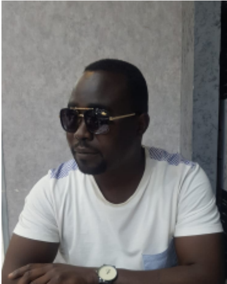
RD: Dolpá Adda

Yáa kakkíré'ñ Aldí Kaa ayíná ge kin alá in kwě ittín dfeñ díó kee ? Kwě ittí ìt-lé paago ná júriña ás keba álán jíjí bá tísánán suwâl pættó jíníti ?