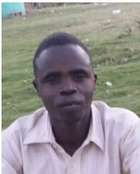
RD: Nuun̄ Bar̄iña Aw

Aldí wúo maár na Nyanja'ñ: Asidíg maár álbá nyãña álán kéén aala-sí jagi, namá nyãña nás kíen soga ittâ d̄i kar̄ūl asábá lóó weél dakki piá ná kúduña jaawíl póttândiñ kurol íde namás kéén jaaruña na kéén aala-sí inkwã,"ká na k̄b̄iña'ñ ála sunjá-ii nás koónjá ká-sí na áisa dúin̄ elle'ñ jáwla nan̄ dog ása lóó weél saa sunjá dakki piáñy ká álán awñí dúin̄ ray ila gal ãl undí gal ãl