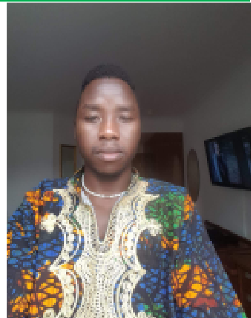
RD: Siirínkása Póngórd#ño