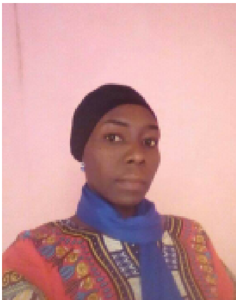
RD: Selsêle Arûn

wérré poor lótáná sunñâs kee, wérré poor kééñ kwa sunñâ eré gɛɛd káwe, marañ díenj kilmánj pɛttíñ jéélénj wérré, ñ díó binjé naa namá botíñ álán yeenja-sí baránj dáíñ wérré, ñ díó . *Na god yeenj alá dáíñ sɛɛɛ-lé kạñ tír bi tíir kalñas , yeenj