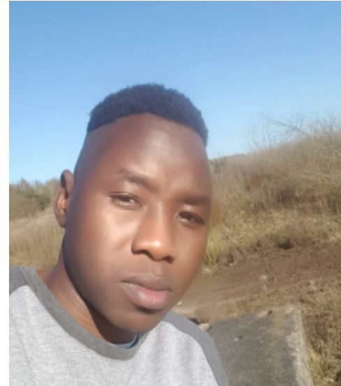
RD: Siirínkása Póngórd̄uño

Dogólá albá k̄aḡñ̄le ná d̄úo bain-si tánáña ná yé kí tarña ñlon̄ na dééñ imme ná yee nima pii ná d̄irbo'ñ ila ná