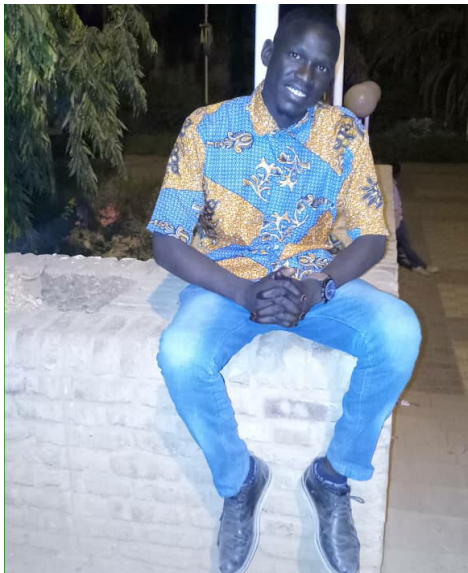
RD: Kamal'ín kwě

Kamal'ín kwě sime: pojora'ñ sog 2021/6/25