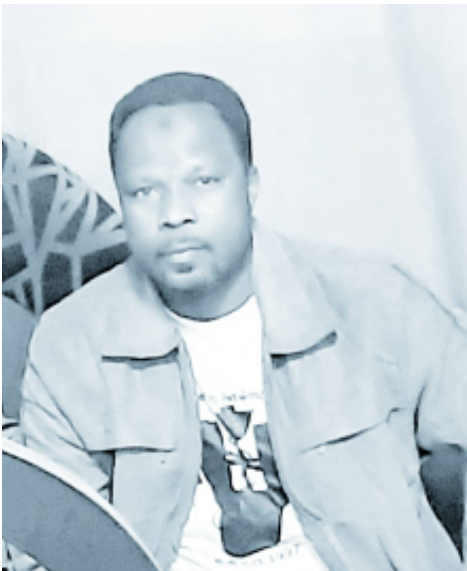
RD: Markíno Poor

koiñí ásán tááríñá'ñ kormi tyéña k'emmó álán káíñ beerañ tabúñ taraas jtal,