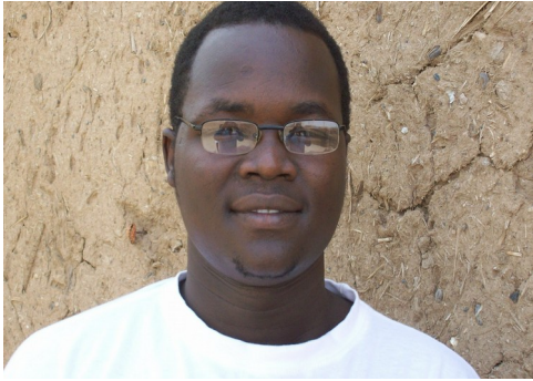
Gaud Páálí: Bariwǎrig Tóóduó